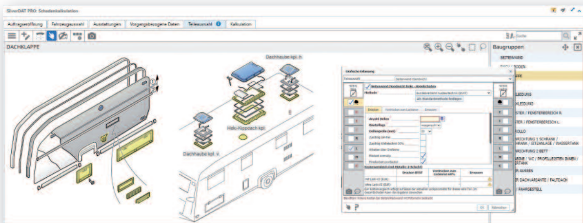
Zuverlässige Kalkulation mit SilverDAT

Da ist es praktisch, dass die SilverDAT zu vielen Basisfahrzeugen der Reisemobile umfangreiche Daten enthält, welche zum Beispiel die Kalkulation typischer Standard-Reparaturen oder Wartungsarbeiten an der Fahrzeugtechnik ermöglichen. Mit der Weiterentwicklung des „CIVD Reparaturhandbuches“ erhöht die DAT zugleich die Kalkulationsmöglichkeiten an den Reisemobilen und Caravans. Auf diese Weise können Werkstätten und Sachverständige Schäden schnell und präzise kalkulieren.